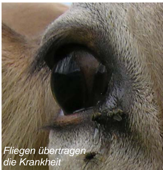
Fliegen übertragen die Krankheit

Die Weidekeratitis, medizinisch korrekt die infektiöse bovine Keratokonjunktivitis (IBK) oder ansteckende Augenzündung der Rinder , ist eine Erkrankung, welche Weiderinder jeden Alters befallen kann. In der Schweiz jedes Jahr wieder besonders gefährdet sind die Alpengrinder , weil die empfindlichen Rinderaugen durch die intensive UV-Strahlung in der Höhe stark gereizt werden können!